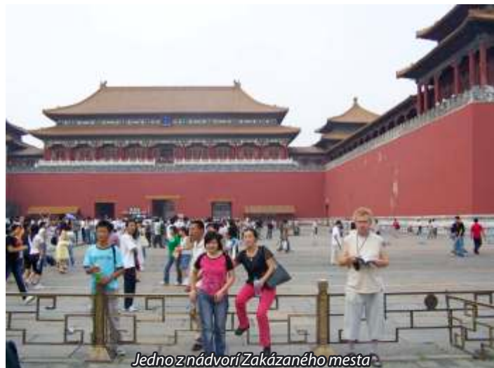
Jedno z nádvorí Zakázaného mesta