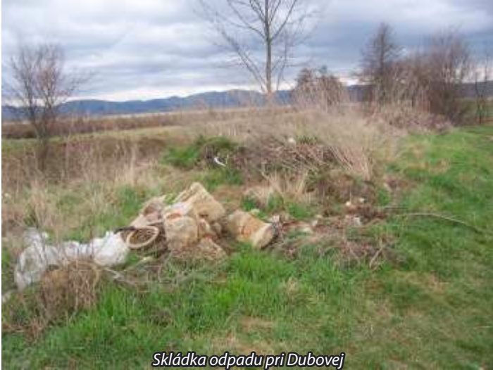
Skládka odpadu pri Dubovej