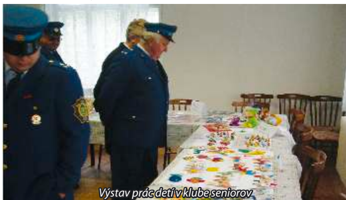
Výstav prác detí v klube seniorov