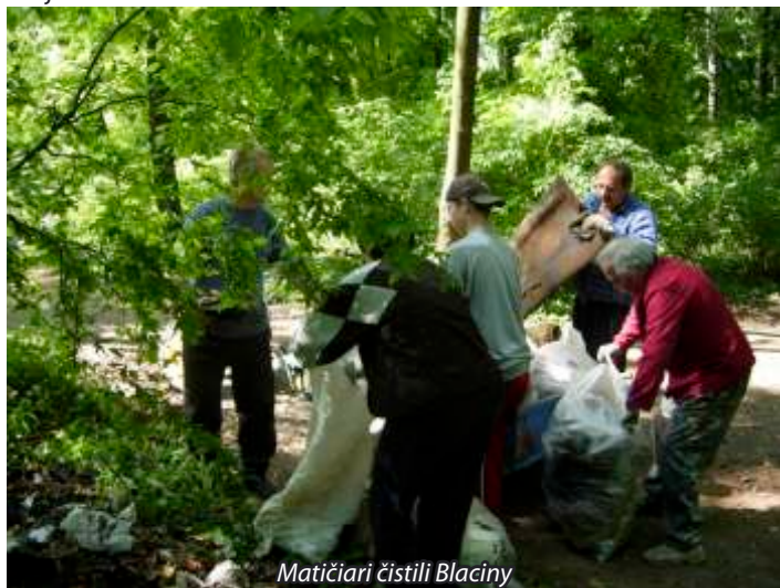
Matičiarci čistili Blaciny

Kedysi dávno, už nikto nevie prečo, naši predkovia dali lesíku takýto názov. V starých mapách je zakreslený s rozlohou asi 14 ha, no dnes má výmeru už len cca 8 ha. Prečo naši predkovia nevyklčovali všetky stromy (kedysi bola naša lokalita zalesnená celá), ale ponechali tento kus lužného lesa? Určite tu bol pragmatický dôvod – suché drevo na kúrenie, ale bol to jediný dôvod? Neslúžil lesík na romantické prechádzky zaľúbencom, v nedávnej minulosti na vychádzky rodín a poznávacie školské prechádzky? Čo sa stalo, že nám akosi odpadla chuť navštíviť tento príjemne voňajúci kútik našej prírody? Bohužiaľ, v posledných rokoch sme nechali les zdevastovať a premeniť na skládku. Čo tu necháme našim deťom, čo si budú myslieť, ako budú na nás spomínať, zaujíma nás to vôbec?