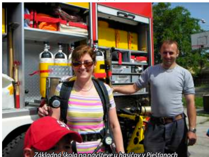
Základná škola na návšteve u hasičov v Piešťanoch

Na začiatku akcie hasiči porozprávali deťom o svojej práci a pripomenuli telefónne čísla, ktoré je potrebné vedieť v prípade nebezpečenstva - požiaru, úrazu, nehody. Silné plamene nie sú jediným nebezpečenstvom, ktoré hasičov ohrozuje, musia bojovať i s oslepujúcim a dusivým dymom. Hasiči musia vedieť správne používať celý výstroj protipožiarneho vozidla, od ostrých rezačiek až po vysokotlakové hadice. Na strechy horiacich budov sa dostávajú pomocou vysúvacích rebríkov s bezpečnostnou klieťkou na konci. To všetko mali možnosť naše deti vidieť. Na dvore hasičskej stanice hasiči predvedli deťom hasičské autá a ich vybavenie. Každé protipožiarne auto má niekoľko úschovných skriniek na uskladnenie záchranárskeho náradia. Bola tu aj ukážka zásahu s vodou, prvej pomoci a ukážka oblečenia, v ktorom hasiči zasahujú pri požiaroch.