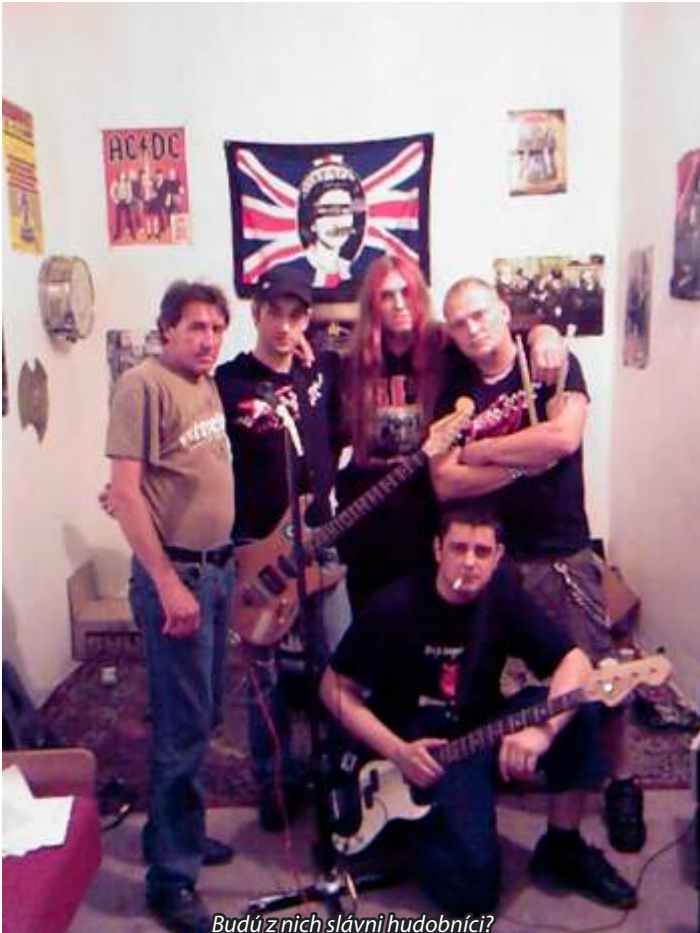
Budú z nich slávni hudobníci?

Sme radi, že starosta obce nám vyšiel v ústrety a poskytol nám miestnosť, kde môžeme cvičiť. Naším cieľom nie je búchať do hudobných nástrojov, robiť čo najväčší hukot a rachot. Našou hudbou nechceme narúšať nočný pokoj ani medziludské vzťahy v obci. Chceme sa len venovať tomu, čo nás baví a to je hudba. Myslíme si, že na tom nie je nič zlé.