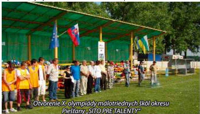
Otvorenie X. olympiády málotriednych škôl okresu Piešťany „SITO PRE TALENTY“

Športová olympiáda málotriednych škôl okresu Piešťany „SITO PRE TALENTY“ napísala svoju jubilejnú X. kapitolu dňa 27. mája 2008 na futbalovom ihrisku TJ Slovan Veľké Orvište. Zúčastnilo sa na nej okolo 400 žiakov a pedagógov z jedenástich základných škôl. Súťažilo sa v piatich disciplínach: beh na 60 m, minimaratóň, hod kriketovou loptičkou, vybíjaná dievčat a minifutbal chlapcov.