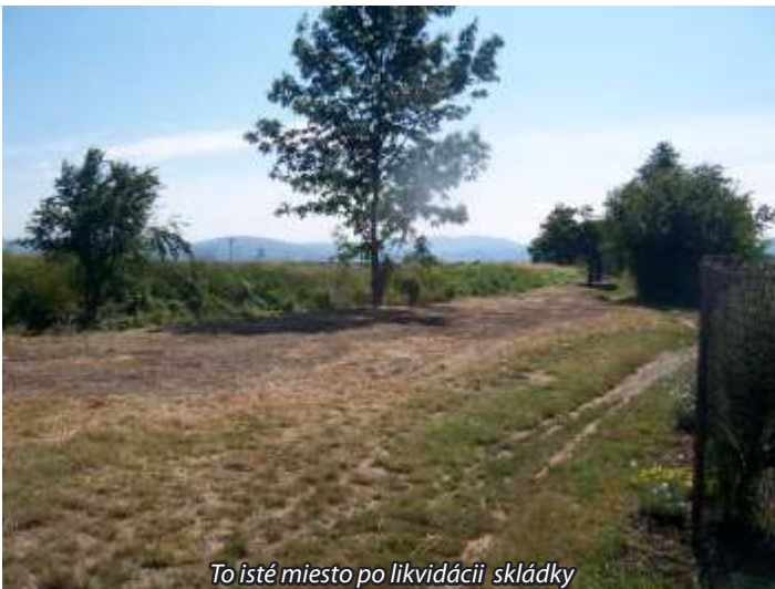
To isté miesto po likvidácii skládky