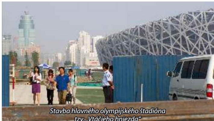
Stavba hlavného olympijského štadióna tzv. „Vtáčieho hniezda“

V Pekingu sme ďalej navštívili miesto budúcich Olympijských hier 2008. Prvýkrát sme vyskúšali pekingské metro. Vzhľadom na to, že nápisy sú aj v angličtine, rýchlo sme sa zorientovali. Na rozdiel od pražského metra sú koľajnice od nástupišťa oddelené priehľadnou stenou, ktorá sa otvorí až po zastavení vlaku. Posledný úsek k štadiónom sme sa viezli v malej búdke ťahanej za motocyklom. Supermoderný hlavný štadión, ktorý pripomína svojou architektúrou vtáčie hniezdo, plavecký štadión, ktorý je zvonku pokrytý hmotou pripomínajúcou bubliny, budúce olympijské hotely, prístupové cesty a pod. predstavovali veľké, rušné stavenisko.