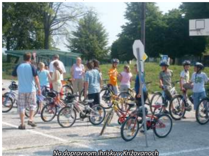
Na dopravnom ihrisku v Križovanoch