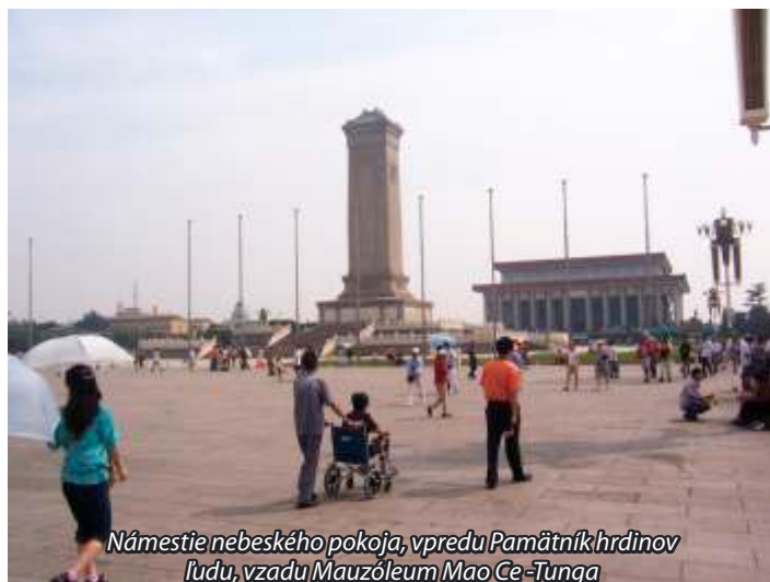
Námestie nebeského pokoja, vpredu Pamätník hrdinov ľudu, vzadu Mauzóleum Mao Ce -Tunga

celého sveta“ a po ľavej strane nápis „Nech žije Čínska ľudová republika“. Práve z tejto brány vyhlásil Mao 1. októbra 1949 Čínsku ľudovú republiku.