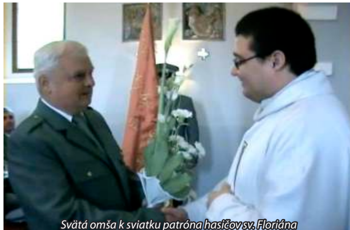
Svätá omša k sviatku patróna hasičov sv. Floriána

Chceme, aby ľudia správne pochopili, že nie všetci občania si môžu z rôznych dôvodov vybudovať kúpeľňu. Niektorí, keď boli mladší, dokázali si nanosiť a zohriať vodu do vane, a tak sa poumývať, teraz keď už nevládzu, je tu pre nich toto zariadenie. Zariadenie je udržiavané v čistote, pravidelne dezinfikované. Až na pár svetlých výnimiek, akoby mali ľudia určité zábrany využívať túto službu. Občanom sa snažíme pomôcť aj s čistým oblečením. S veľkou vďačnosťou prijal posteľnú bielizeň a šatstvo od našej poslankyne aj DOMUM v Piešťanoch a ďalšia posteľná bielizeň poputuje do zariadení sociálnych služieb, v ktorých sú umiestnení naši občania.