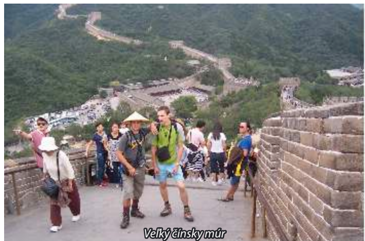
Veľký čínsky múr

V Pekingu sa nám veľmi páčilo, ľudia boli priateľskí, ceny prijateľné. Oblúbili sme si jednu reštauráciu na našej uličke. Každý deň sme sa tešili na večeru v príjemnom prostredí priamo na úzkej, rušnej uličke. Pikantné čínske jedlá sme jedli samozrejme paličkami, čínske pivo bolo výborné, nálada skvelá. V Pekingu sú tisícročné pamiatky i supermoderné štvrte. Lúčili sme sa s túžbou znovu sa do Pekingu vrátiť.