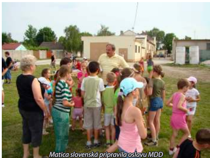
Matice slovenská pripravila oslavu MDD

Po kultúrnej časti programu na „hodovom“ priestore za kultúrnym domom nasledovala druhá časť, športové zápolenie detí. Súťažilo sa v šiestich disciplínach: maľovanie na chodník, beh vo vreci, beh s vajcom na lyžici, hádzanie kruhov na pevný cieľ, jedenie slivkového koláča so zapečeným päťkorunákom v strede, pitie z fľaše. Deti sa pri veselých disciplínach zasmiali a dobre sa zabávali. Počas prestávky, sme rozdali deťom lízanky a lístky na zmrzlinu. Za chvíľu sa ihrisko vyprázdnilo a už sa detský mrak hmýril obďaleč pred zmrzlinovým stánkom.