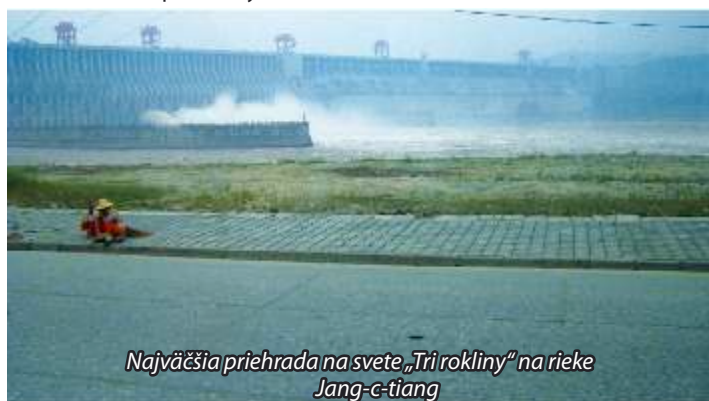
Najväčšia priehrada na svete „Tri rokliny“ na rieke Jang-c-tiang

Rieka Jang-c-tiang je mohutná s kalnou vodou. Symbolicky sme si v rieke omočili aspoň ruky. Asi 40 km od mesta sa nachádza obrovská priehrada Tri rokliny. K priehrade sa konajú z mesta Yichang turistické zájazdy, jedného sme sa zúčastnili aj my. V okolí priehrady bolo hmliсто, takže výhľad nebol ideálny. Ale ja tak bolo vidno, že je to mohutné dielo. Je to najväčšia priehrada na svete s výškou priehradného múra 185 m a dĺžkou 2309 m a súčasne najväčšia čínska stavba po Veľkom čínskom múre. Turbíny vyrobia také množstvo elektrickej energie, ktoré by mohlo zásobovať celé Belgicko. Aj v Yichangu bolo plno malých čínskych reštaurácií, čínske jedlo aj pivo bolo dobré, ani čínske paličky nám uže nerobili problémy.