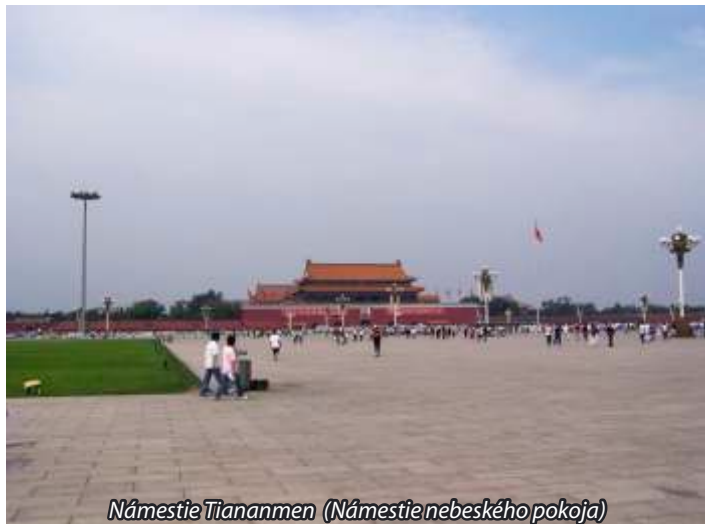
Námestie Tiananmen (Námestie nebeského pokoja)

Pri vstupe na námestie z južnej strany sa nachádza Predná brána z dynastie Ming. Voľakedy bola súčasťou hradiieb, ktoré oddeľovali vnútorné mesto, tzv. tatárske (mandžusko-mongolské) mesto, od vonkajšieho čínskeho mesta. Na západnej strane je veľkolepý Palác ľudových zástupcov. V budove zasadá Všečínske zhromaždenie ľudových zástupcov, t.j. čínsky parlament. Na východnej strane námestia sa nachádza Múzeum čínskej histórie a Múzeum čínskej revolúcie. Pred budovou sú umiestnené hodiny, ktoré odpočítavajú čas do otvorenia Letných olympijských hier.