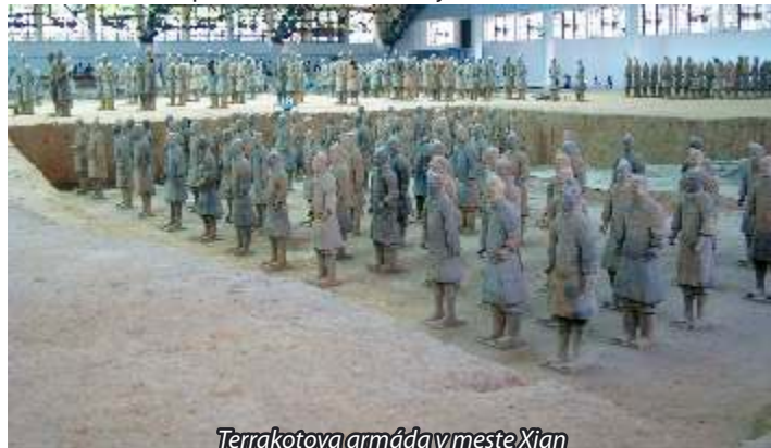
Terrakotova armáda v meste Xian

terakotovej armády, najväčšieho archeologického objavu 20. storočia. Túto armádu hlinených vojakov čínsky cisár použil na oklamanie nepriateľa. Pohľad na rady obrovského množstva hlinených vojakov, koňov a jazdcov v životnej veľkosti je úchvatný. Vykopávky sa nachádzajú v obrovských zastrešených halách. V strede mesta sa nachádza veľká a pekná stavba Zvonovej veže.