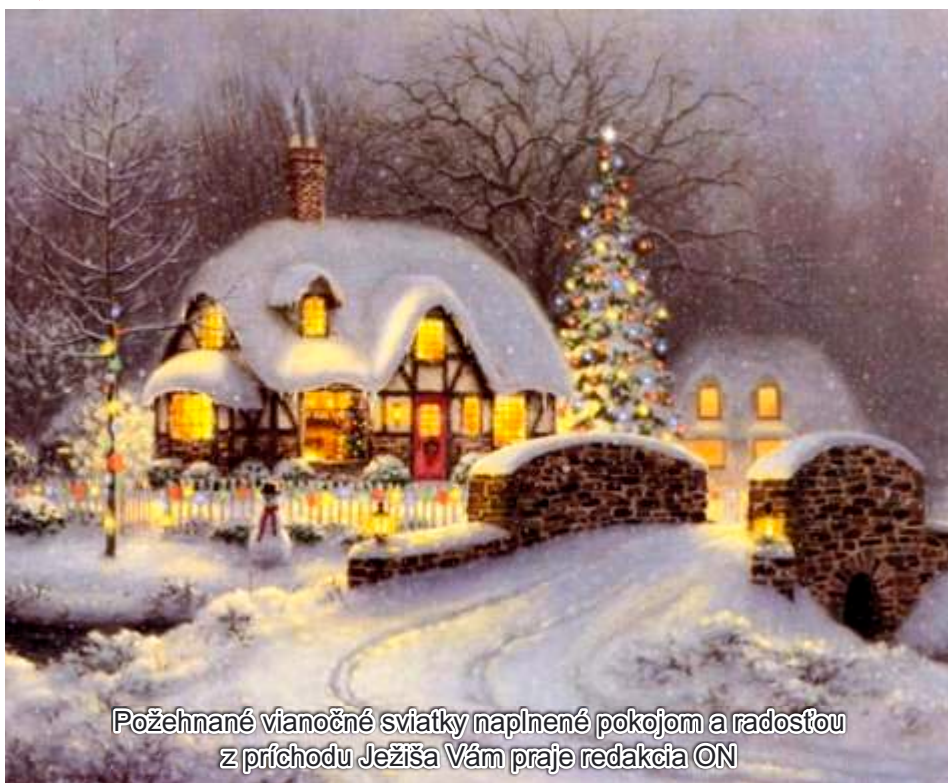
Požehnané vianočné sviatky naplnené pokojom a radosťou z príchodu Ježiša Vám praje redakcia ON