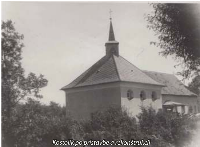
Kostolík po prístavbe a rekonštrukcii

Veža: Vchod na chórus a vežu je spoločný. Vedú tam drevené schody.