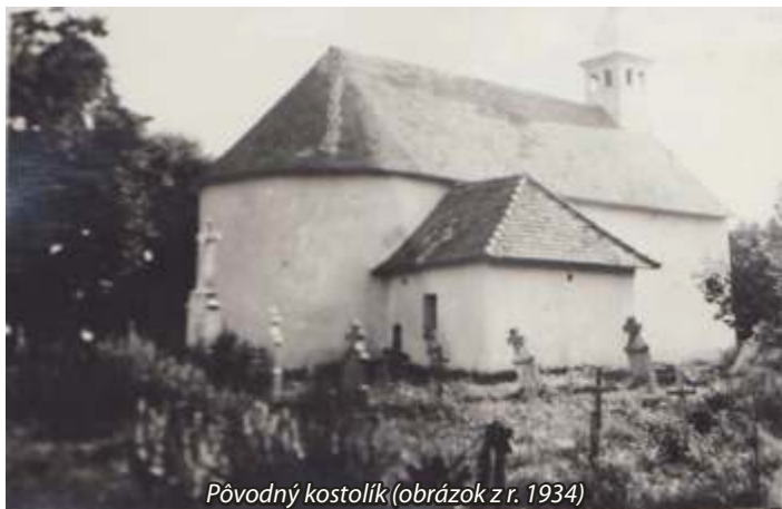
Pôvodný kostolík (obrázok z r. 1934)

V obecnej kronike je opis kostola v našej obci nasledovný (1934). Na cintoríne stojí starobyľý jednověžový filiálny kostol. Jeho múry sú dopukané. Východná - oltárna strana tvorí polkruh. Kostol má 5 okien. Na pravej strane vo východnej časti je malý výklenok - sakristie. Kostol je pokrytý škridlou. V jeho stavbe sa javia prvky viacerých slohov, z čoho sa usudzuje, že bol viac ráz zničený a opravovaný. Vchod do kostola umožňujú dvojkrídlové dvere z ľavej strany. Vnútorne miesto kostola tvoria loď, sakristie a chórus.