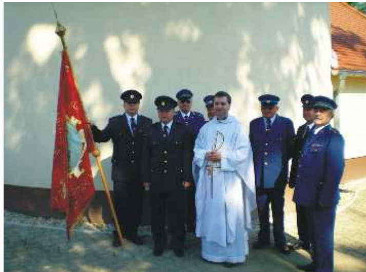
Pred Floriánom v 15. storočí boli ochrancami pred ohňom sv. Agáta a sv. Vavrinec.

Vyobrazenia Floriána sa vyskytujú tiež aj na priečeliach domov, v erboch, na pečatiach, rázcestiach a hlavne na hasičských zbrojniciach.