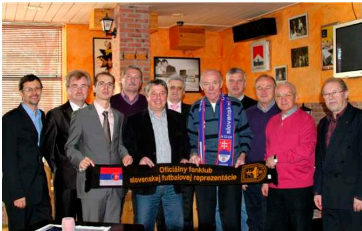
Ján Popluhár sa stal čestným predsedom Oficiálneho fanklubu slovenskej futbalovej reprezentácie 29.11.2010 v Bernolákove.