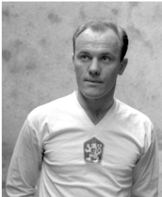
Ján Popluhár, v roku 2000 vyhlásený za futbalistu storočia na Slovensku

Narodil sa 12. 9. 1935 v Bernolákove. Jeho futbalová história je mimoriadna. Začínal v rodnom Bernolákove, ďalej hral v Slovane Bratislava, v Rudej Hvěзде Brno, v Olympique Lyon, v Zbrojovke Brno a v Slovane Viedeň. Reprezentoval 62- krát, jediný gól v reprezentácii dal Brazílii na slávnej Maracane. Štartoval na MS 1958 a 1962, v nezabudnuteľnom finále s Brazíliou získal striebro. Bronz má z ME 1960.