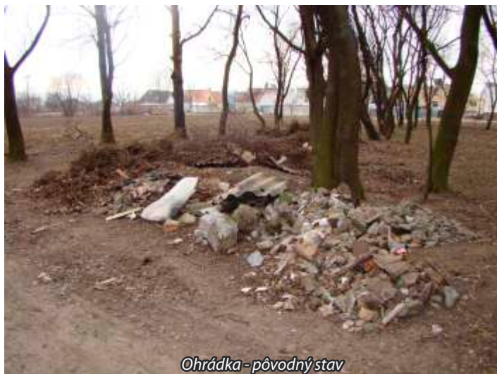
Ohrádka - pôvodný stav

Pri utváraní životného prostredia máme aj dobré výsledky. Predovšetkým zásadne k lepšiemu sa zmenil vzhľad námestia, prilahlej Hlavnej ulice a Školskej ulice. Vznikla skutočne pekná centrálna zóna obce. Zónu budeme ďalej dotvárať.