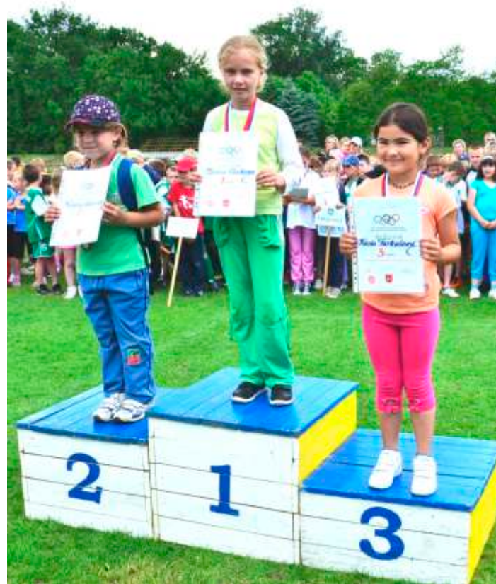
Našou najúspešnejšou disciplínou bol hod kriketovou loptičkou mladších žiačok, kde sme vybojovali prvé dve miesta.