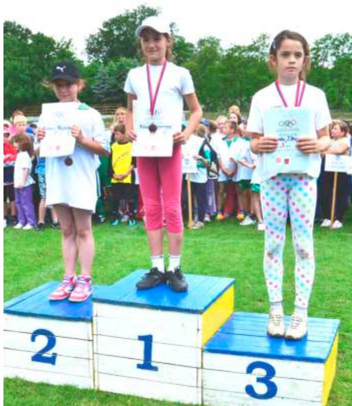
Nikolka Niznerová získala zlatú medailu v hode kriketovou loptičkou i na svojej štvrtej olympiáde.