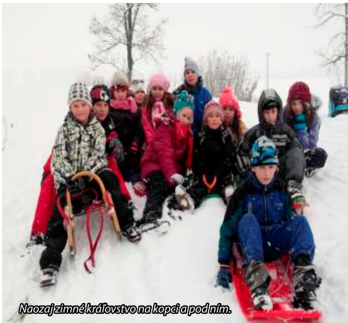
Naozaj zimné kráľovstvo na kopci a pod ním.

Zima je krásne ročné obdobie. Z neba sa na nás jemnučko znášajú pestré vločky snehu. Ráno nás mráz štípe na tvári. Spočiatku nám zima nechcela nadeliť snehovú nádielku, aj keď pred Vianocami to vyzeralo sľubne. Po vianočných prázdninách nás všetkých potešil nový sneh, ktorý sme využili na školskú sánkovačku. Chodili sme často, ako inak, na náš osvedčený kopec pri rybníku. Deti sa nielen posánkovali, ale aj vyvávali v snehu, postavili sánkarskú dráhu. Riskli sme to tiež na strmšom kopci, kde deťom nechýbala odvaha, ukázali svoju nebojácnosť a zmysel pre humor. Vrátili sme sa vymrznutí, ale šťastní z príjemne strávených chvíľ. Tento rok som si konečne aspoň raz zobrala fotoaparát, a tak sme celú krásu mohli nafotiť. Na kopci i pod ním to vyzeralo úžasne, zapadali sme po kolená do snehu, na ceste odhrňáče ešte nestihli urobiť svoju robotu, autá nejazdili a my sme si pripadali ako niekde v Tatrách. Na školskom dvore sme postavili snehuliakov, ale aj psíka, medveďa, slimáka, húsenicu.. Nanešťastie trvá táto krása tak krátko, že si musíme čo najrýchlejšie užiť sánkovačky, guľovačky a korčuľovania ešte skôr, než našim snehovým kamarátom zmäkne hlava a odpadne mrkvový nos. Minulý rok sme sa často chodili aj korčuľovať, ale tohto roku až také mrazy neboli, a tak sme korčuľovanie museli oželiť. Tak, ako všetko, musí skončiť aj zima. Ľadové kráľovstvo sa mení na uplakanú krajinu, v ktorej sa roztápa sneh a zrkadlá ľadu sa strácajú. Zima sa musí vystriedať s jarom.