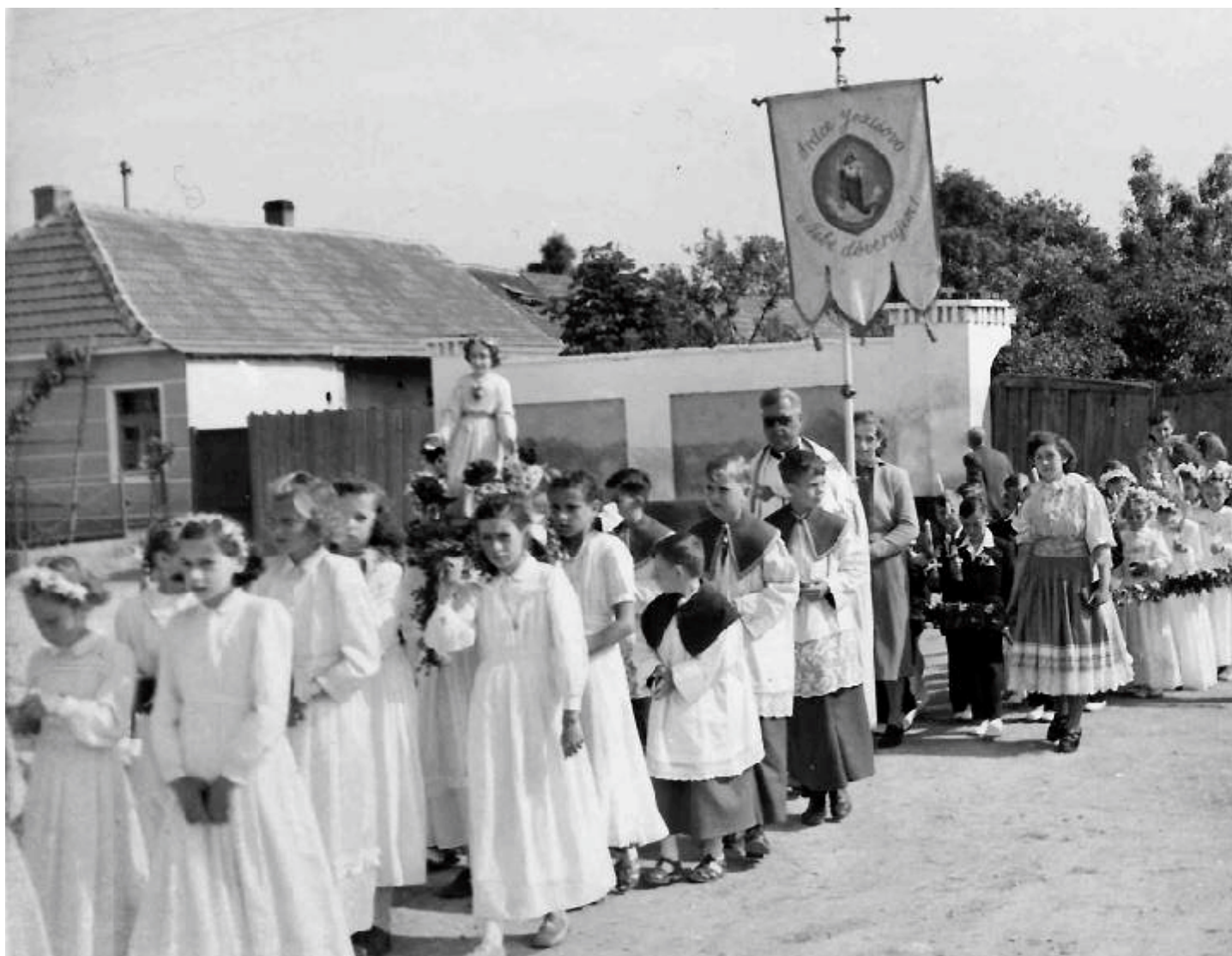
Prvé sväté prijímanie