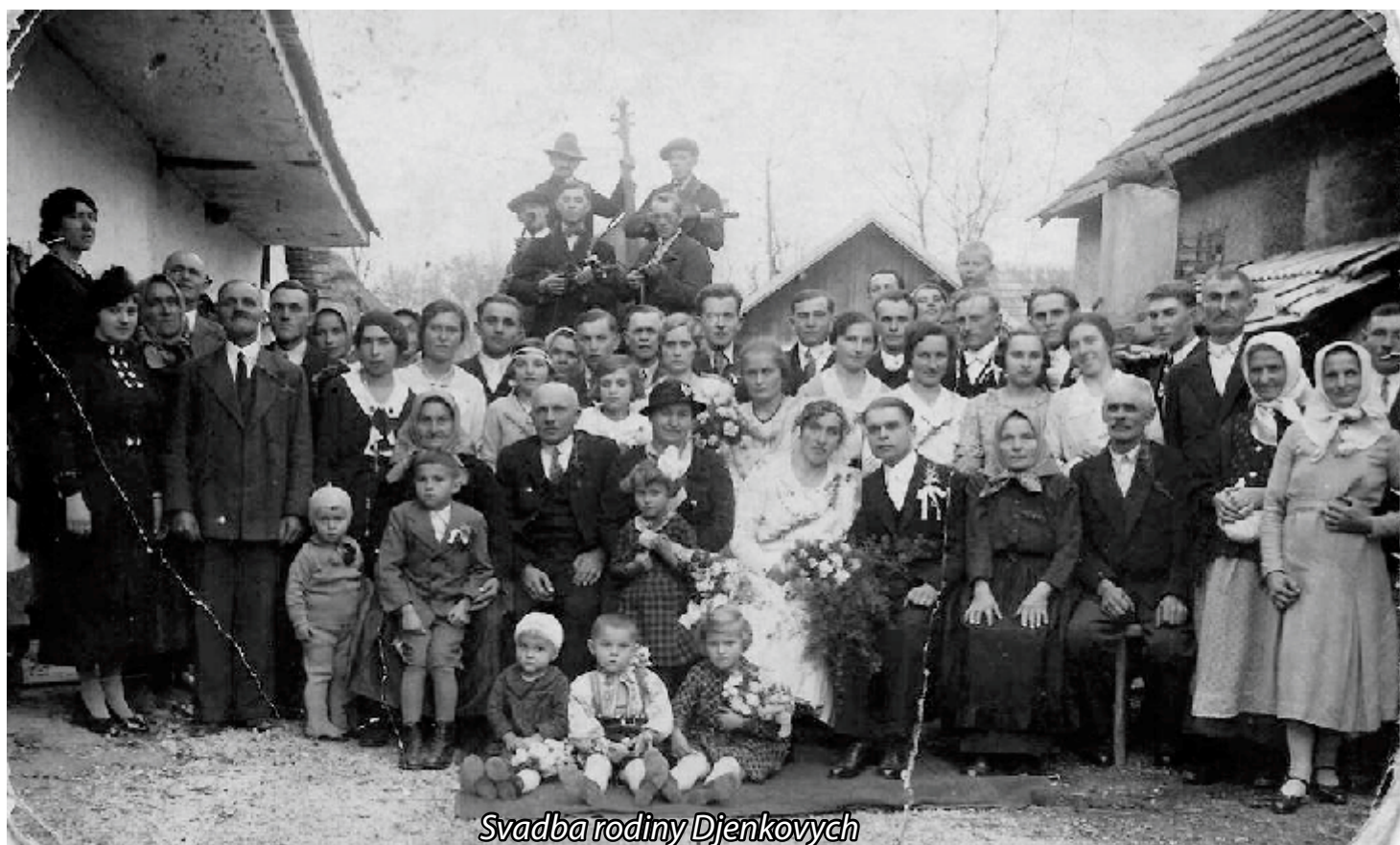
Svadba rodiny Djenkovych