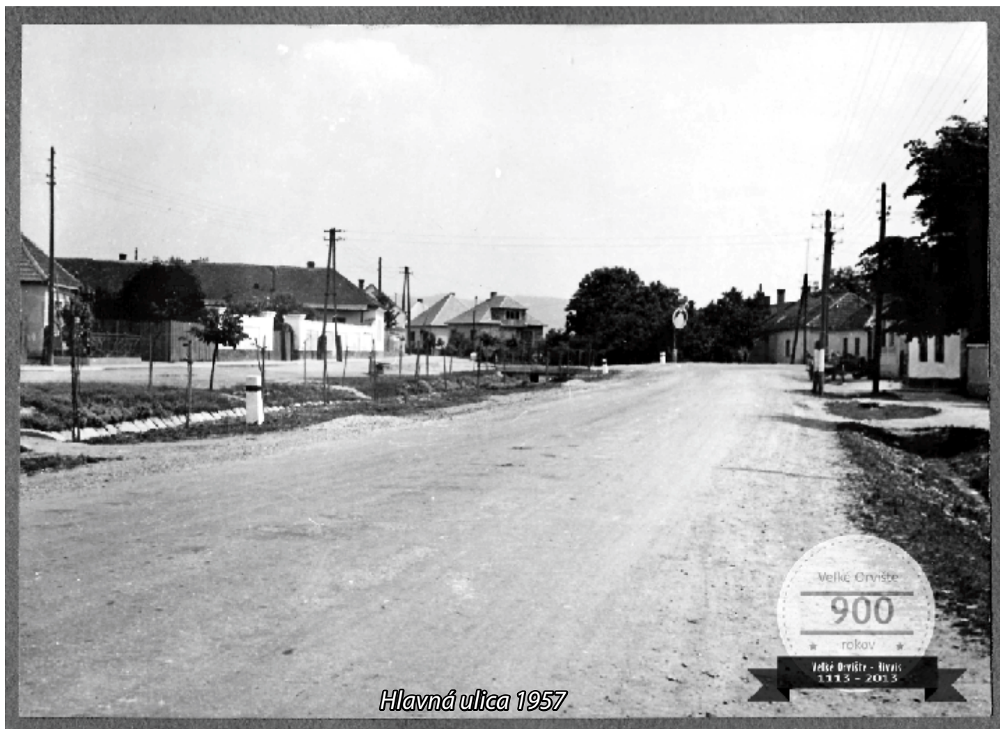
Hlavná ulica 1957