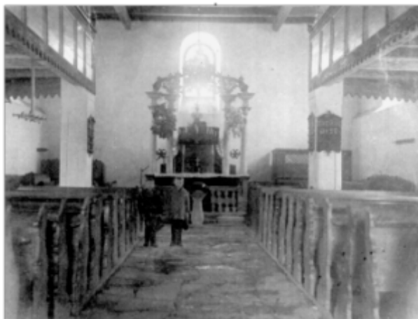
Interiér starého evanjelického tolerančného kostola vo Vrbovom z roku 1784 (zbúraného v roku 1928).