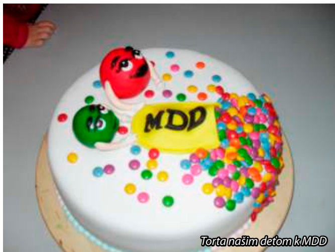
Torta našim deťom k MDD