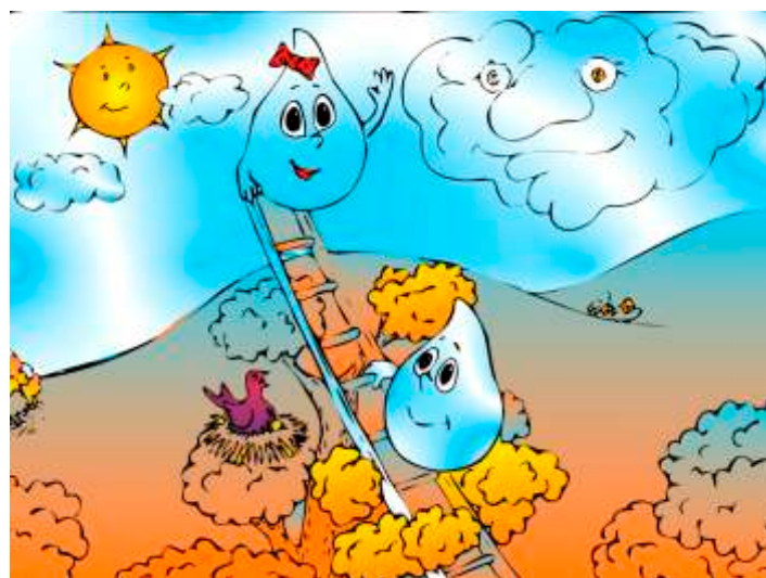
Kvapko a Kvapka