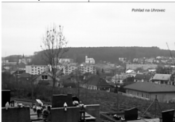
Pohľad na Uhrovce