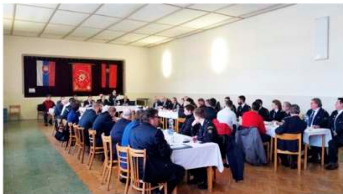
DHZO Velké Orvište, ktorý sa uskutoční 9.5.2015 v našom KD.