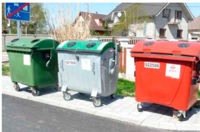
TETRAPAKY - vrecia, 1100l