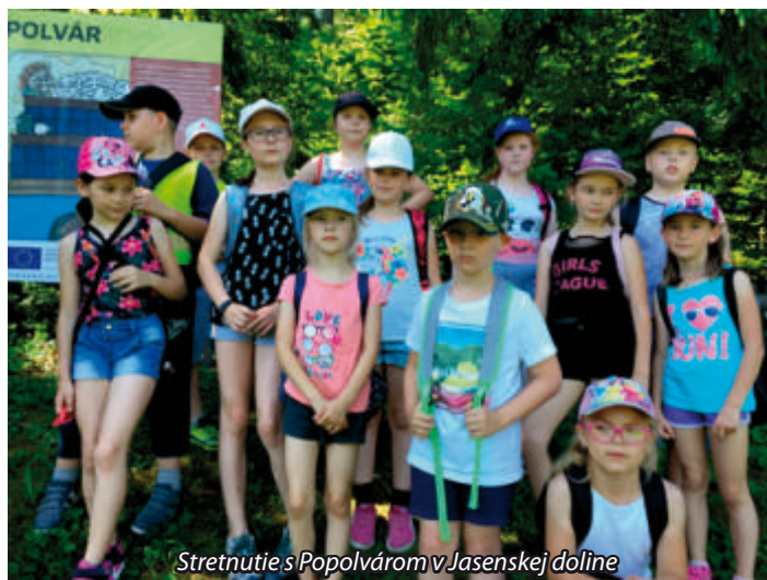
Stretnutie s Popolvárom v Jasenskej doline