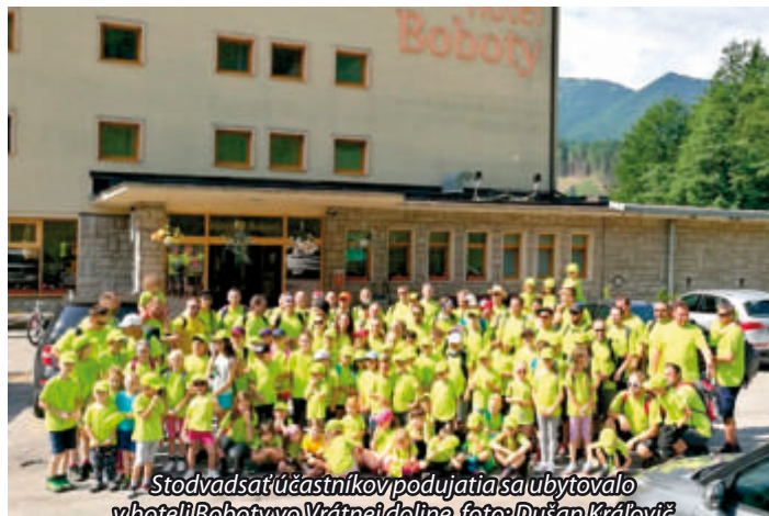
Stodvadsať účastníkov podujatia sa ubytovalo v hoteli Boboty vo Vrátnej doline.

podujatia, kde maminy majú chvíľu čas na seba a oddych a ich muži sa venujú deťom? „Akcia dopadla perfektne a som veľmi rád, že sa nám opäť overila známa pravda. Spočívam vo fakte, že ak deti majú na dennom poriadku rôzne úlohy a povinnosti, zabúdajú na telefóny i tablety. Ja som si