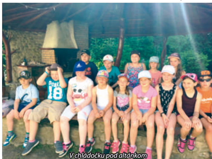
V chládočku pod altánkom