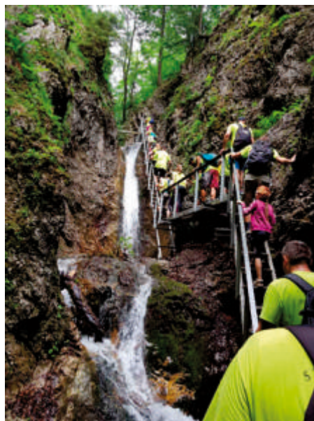
Deti aj tatinovia z piešťanského regiónu každé ráno cvičili.