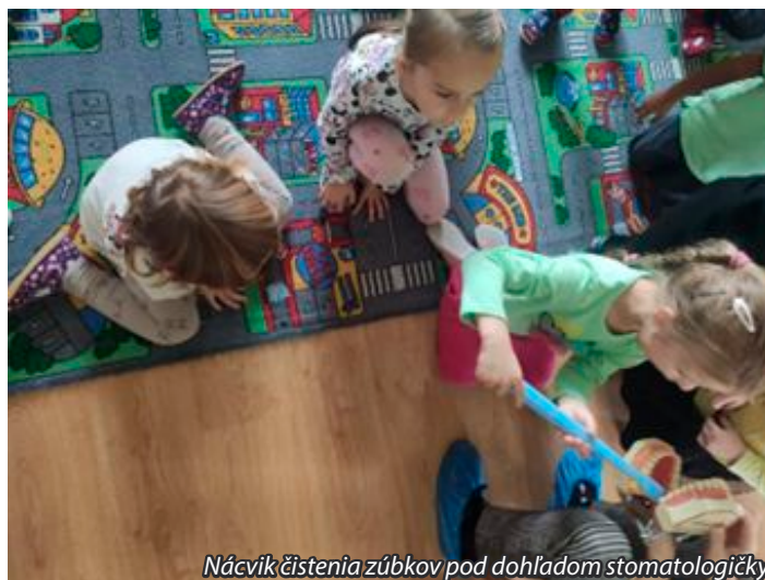
Nácvik čistenia zúbkov pod dohľadom stomatologičky