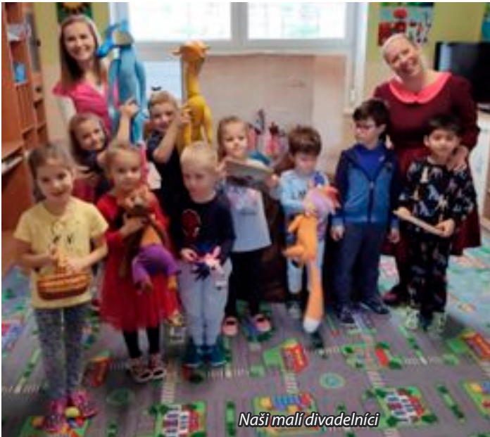
Naši malí divadelníci