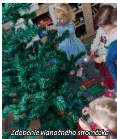
Zdobenie vianočného stromčeka