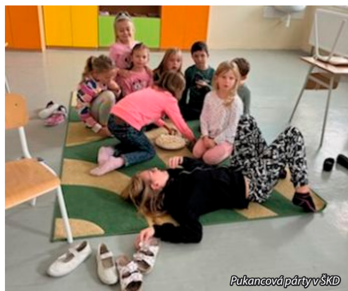
Pukancová párty v ŠKD