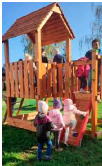
Hracia zostava Fan