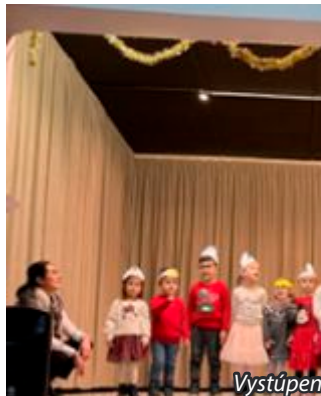
Vystúpenie detí Mikulášovi