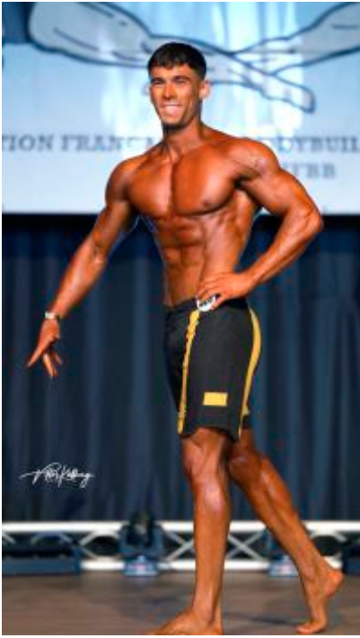
IFBB DIAMOND CUP 2022 v Portugalsku – 2. miesto