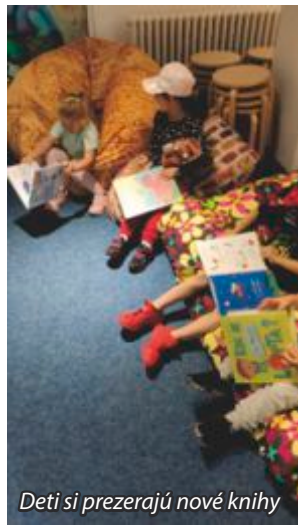
Deti si prezerajú nové knihy