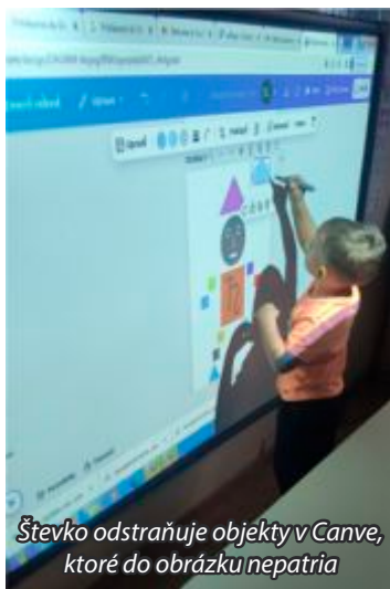
Štefko odstraňuje objekty v Canve, ktoré do obrázku nepatria

Učiť pre budúcnosť a moderne je jednou z našich priorit, a preto sme sa zapojili do výzvy na overovanie inovatívnych metódič. Tieto metódič reflektujú najnovšie digitálne trendy spoločnosti. Našou úlohou bolo jednotlivé metódič preveriť vo výchovno-vzdelávacom procese, na základe realizácie vyhodnotiť ich využitie v praxi a navrhnúť prípadne zmeny. Celkovo sme mali za úlohu overovať päť metódič: Z rozprávky do rozprávky, Geometrické tvary, Vesmír, Domáce zvieratá. Poslednú metódič Vianoce – Vianočné tradície budeme overovať v mesiaci december. Prostredníctvom týchto metódič sa deti zoznámili s aplikáciami Canva, LearningApps, Prezi, Book Creator, Chatterpix, Pixabay.