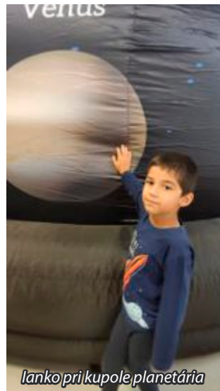
Ianka pri kupole planetária

Zapojili sme sa aj do súťaže s EduPlay a šťastie sa na nás usmialo vo forme 40% zľavy, a tak sa naše deti môžu opäť tešiť na ďalší vzdelávací program, ktorý sme naplánovali na marec 2025.