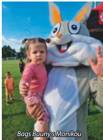
Babs Buunys Monikou

Ďakujeme rodičom, hasičom, dobrovoľníkom, sponzorom, priaznivcom a priateľom školy za krásne podujatie, ktoré zorganizovali pre deti.