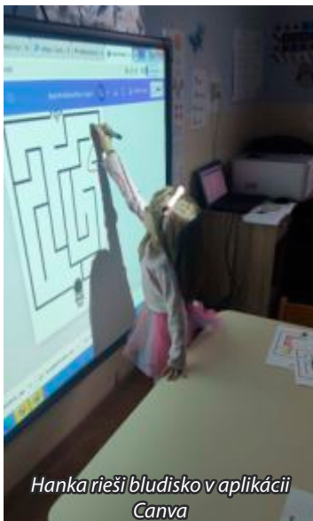
Hanka rieši bludisko v aplikácii Canva