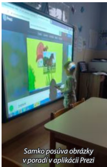
Samko posúva obrázky v poradi v aplikácii Prezi