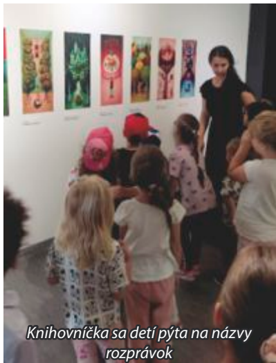
Knižovníčka sa detí pýta na názvy rozprávok