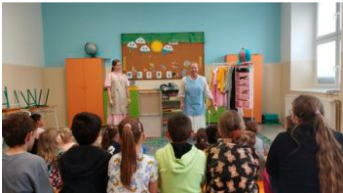
Ukončenie školského roka 2023/2024

krásna princezná, aby sa neprezradila nemilému rytierovi, ktorý ju chcel mať iba pre seba. Uchýlila sa teda v kuchyni v službách kráľa, kde pôsobila pod myšacou bundičkou nenápadne. Námetom tejto ľudovej rozprávky je veľmi známy príbeh o Princeznej so zlatou hviezdou na čele. Naše deti ocenili najmä to, že sa mohli aktívne zapojiť do deja a stali sa tak súčasťou príbehu. Zatancovali si v kostýmoch na kráľovskom bále a stali sa súčasťou orchestra.